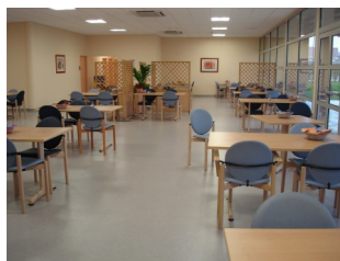
Salle de Restauration

Les repas sont pris dans la salle de restauration climatisée . Le Résident peut également les prendre dans la salle à manger d'hôtes avec sa famille. Le respect des régimes médicalement prescrits est assuré.